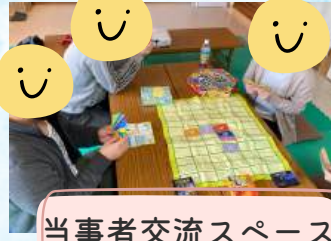
当事者交流スペース