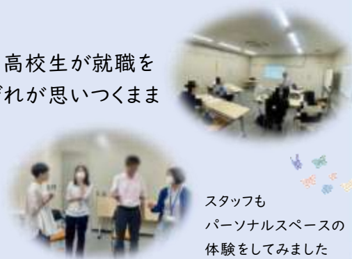
スタッフも パーソナルスペースの 体験をしました

引き続きこのような体験会を実施していく予定です! 次回はもっと来てくれたらうれしいな~